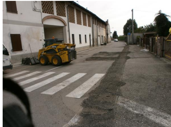
Manutenzione Via Mazzini