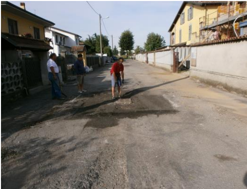
Via Mongiardino prima