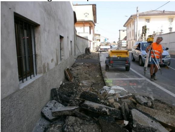
Rifacimento marciapiede Via Colombo