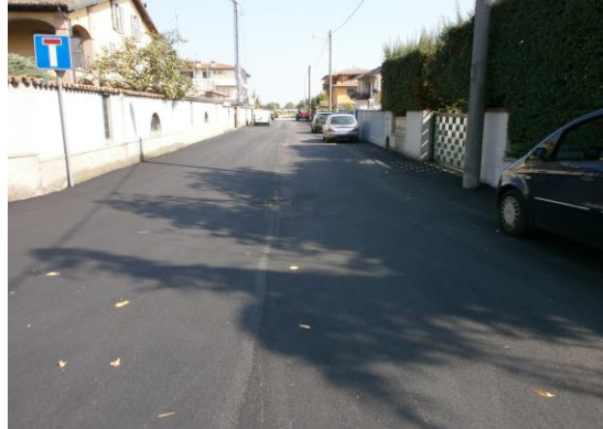
Via Mongiardino dopo