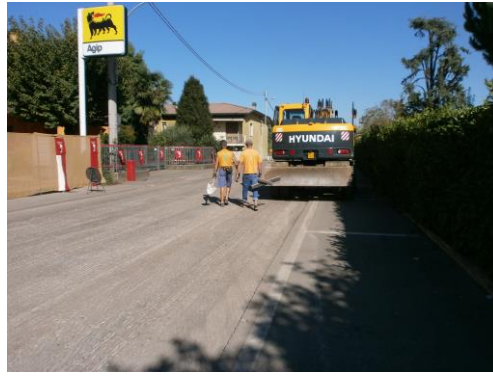
Asfaltatura via Marconi