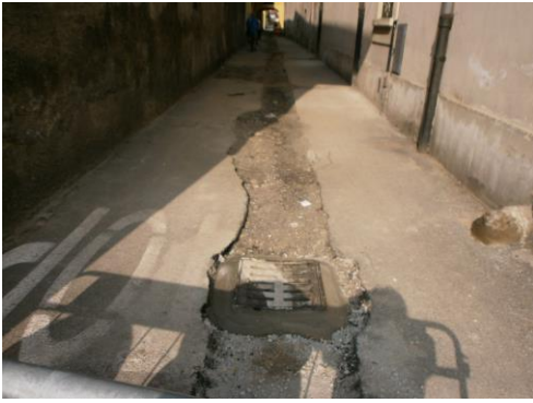
Fognatura Vicolo Oriani